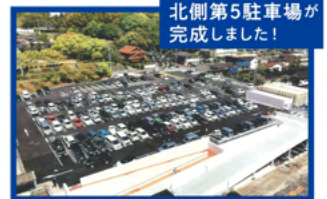
北側第5駐車場が完成しました!