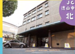
JCHO 徳山中央病院 北館

何かお気付きの点がございましたら、是非とも声を聞かせてください。みなさんに愛される健康管理センターを目指して努力したいと思ひます。